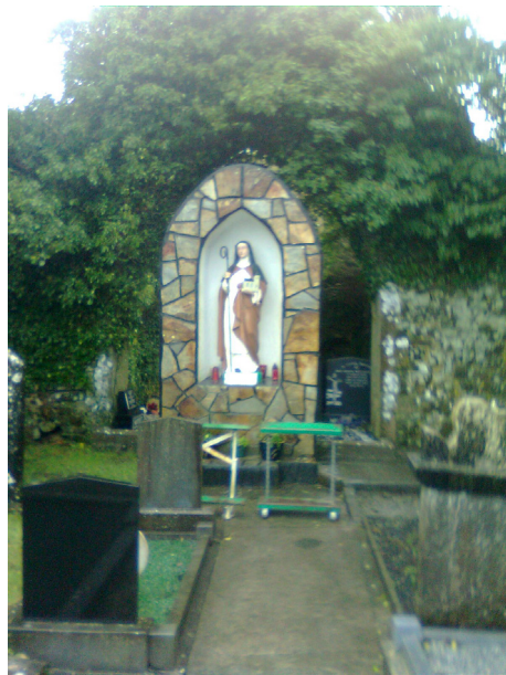
Памятник прп. Ите над ее предполагаемой могилой в Киллиди, Лимерик

Многие приходили к святой, ища утешения, духовного совета и наставления. Было засвидетельствовано немало случаев чудесного исцеления людей по молитвам игумении. Святая вернула к жизни павшего в бою родственника; вернула зрение слепому человеку; исцелила некоего