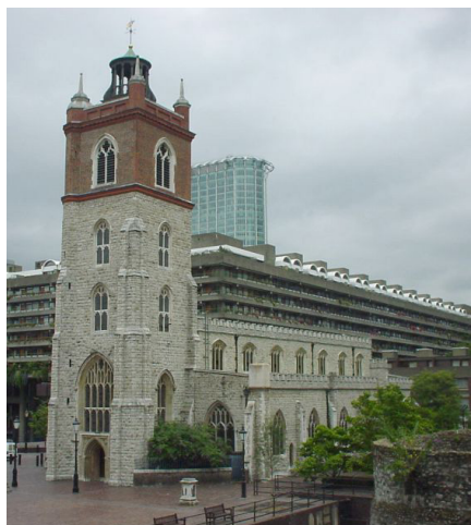
Церковь св. Эгидия в Крипплгейте

Св. Эгидий родился в середине VII века в Провансе на юге Галлии. Большую часть жизни был пустынноиком. Сначала вел отшельническую жизнь в лесной глуши близ рек Рона и Гар в области Септимания. Позднее углубился в дикие леса неподалеку от Нима, где проводил все время в молитве. Единственным спутником святого была олениха (или, возможно, самка лани), кормившая его молоком. Через много лет королевские охотники, преследуя олениху, нечаянно обнаружили святого. Вскоре он основал неподалеку монастырь, впоследствии названный Сен-Жиль-Дю-Гар, где стал игуменом и через некоторое время преставился, почитаемый за святую жизнь и многочисленные чудеса. Вокруг монастыря св. Эгидия, ставшего одним из величайших центров паломничества в Галлии, вырос город Сен-Жиль. Почитание св. Эгидия в средние