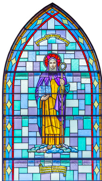
Витраж святой Иты

Святая любила говорить, что «Бог особенно любит в христианине три