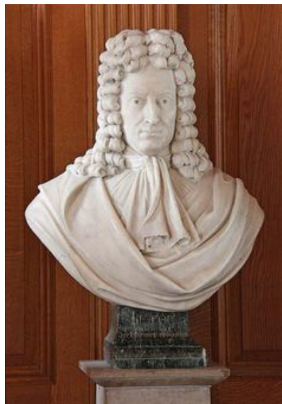
Бюст Д. Дефо в церкви св. Эгидия в Крипплгейте

Полное название прихода звучит так: «Приход св. Эгидия в Крипплгейте и св. Луки на Олд-