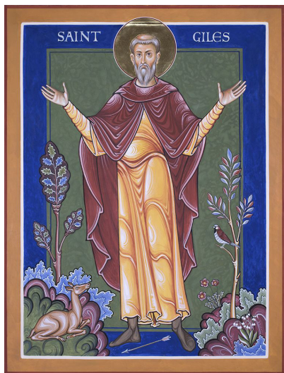
Икона св. Эгидия (иконописец Айдан Харт)

Внутри храма преобладает средневековая атмосфера. У него открытое пространство и множество колонн, имеются алтарь, неф, северный и южный приделы. В интерьере выделяются Большое восточное и Большое западное витражные окна, многочисленные скульптуры и бюсты, посвященные десяткам знаменитостей, тесно связанных с приходом. Часть своего нынешнего убранства (престол, купель, сиденья для прихожан) храм св. Эгидия заимствовал в 1960-е годы у своего соседа – храма апостола Луки, который в то время было решено закрыть. Из глубокого