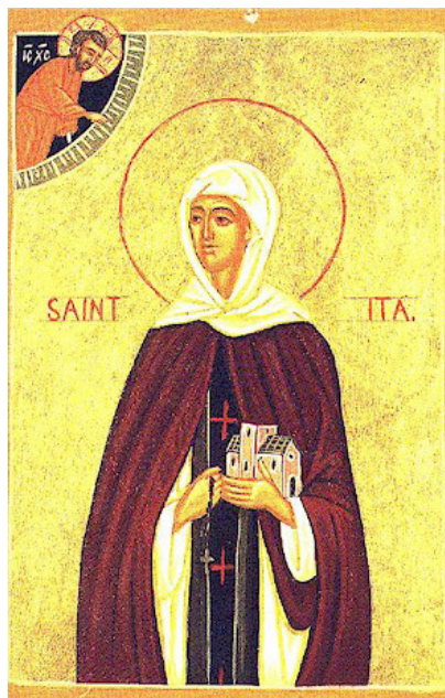
Икона преподобной Иты из Лимерика