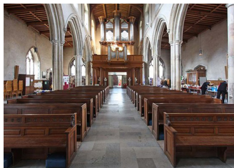
Внутри церкви св. Эгидия в Крипплгейте

Церковь св. Эгидия («Сент-Джайлз») в Крипплгейте (1) (по названию древних ворот в Сити, рядом с которыми она первоначально стояла прямо за городской стеной) находится на Фор-Стрит района Барбикан, где некогда стояла сторожевая башня, а ныне размещается жилой комплекс и крупнейший культурный центр Европы. Первый саксонский храм стоял здесь в XI веке, а в 1090 году, после прихода норманнов, его перестроили. Нынешнее