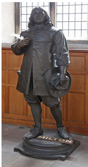
Статуя Дж. Мильтона в церкви св. Эгидия в Крипплгейте

прошлого в храме сохранились, например, немного римских плиток; каменные сиденья для священников; латунный аналой; устройство, куда сливали воду из евхаристических сосудов. На витражах, среди прочих, изображены Христос во Славе, Богородица с лилиями, апостолы Павел, Иоанн Богослов и Варфоломей, покровитель Англии вчч. Георгий и сщмч. Альфедж (принявший мученическую кончину в Гринвиче), которому был посвящен один соседний храм. Покровитель церкви – св. Эгидий – изображен с оленихой и стрелой слева на Восточном окне и с костылем - в верхнем ряду Западного окна. Ему посвящена каменная статуя над северным входом в храм.